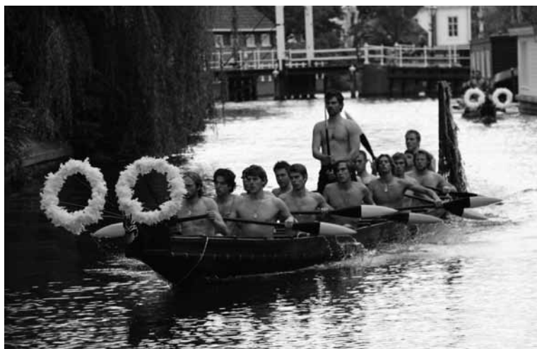
Njord roeiers als peddelaars

Een forse gift van de Sponsorloterij maakte het mogelijk om twee waka's voor het museum te laten bouwen. Een traditionele, gemaakt uit één stam van een kauriboom. De tweede is een polyester exemplaar, afgewerkt met houtsnijwerk, die goed geschikt is om mee te varen. Roeivereniging Njord gaat met deze waka regelmatig peddelen.