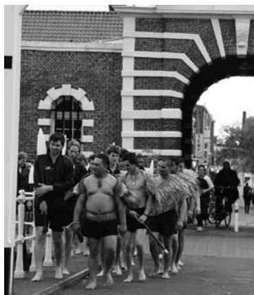
Maori op weg naar hun waka