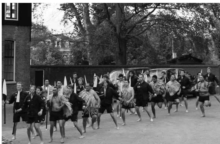
De Maori oefenen samen met de roeiers van Njord een dans

Eind oktober opende het Museum van Volkenkunde een tentoonstelling over de Maori. Zo'n achthonderd jaar geleden zijn deze traditionele bewoners van Nieuw-Zeeland met hun waka's (kano's) vanaf eilandgroepen in de Stille Zuidzee het land binnengekomen. Eeuwenlang zijn de waka's hun enige transportmiddel gebleven: een interessant antropologisch onderwerp voor een tentoonstelling in een Volkenkundig Museum.